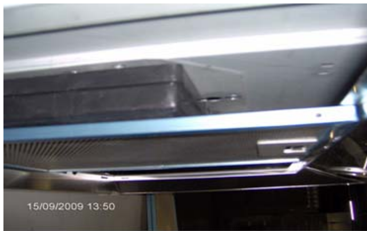
Abb. 1: Einbausituation mit Kohlefilter ZUB 612

Bei Verwendung des Kohlefilters ZUB 612 (ET-Nr. 538022) kann es bei den oben genannten Dunst- abzugshauben auf Grund der Bauform des Kohlefilters zu Problemen bei der Erfassung des Koch- wrasens im Umluftbetrieb kommen (siehe Abb. 1).