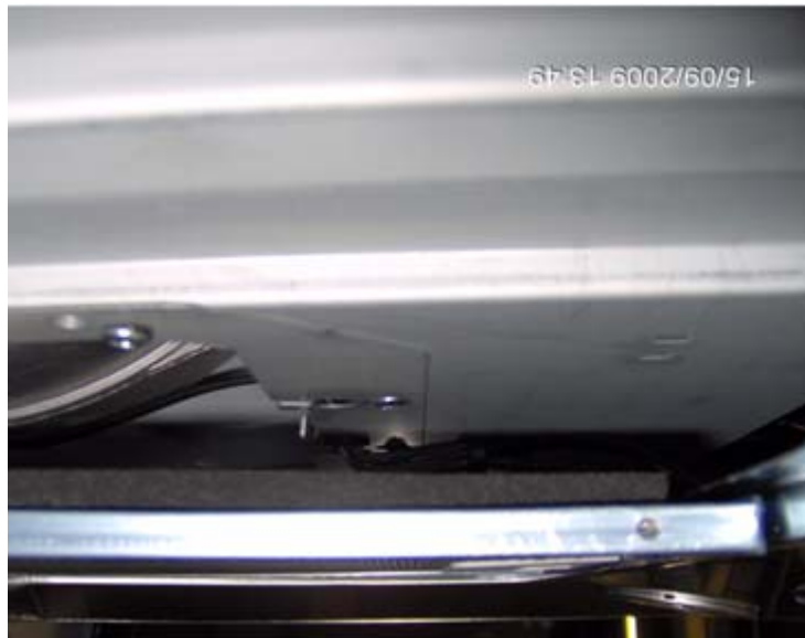
Abb. 3: Einbausituation nach Einbau des neuen Fettfilters mit der Kohlefiltermatte

Die Befestigungsbügel sind nicht einzeln lieferbar.