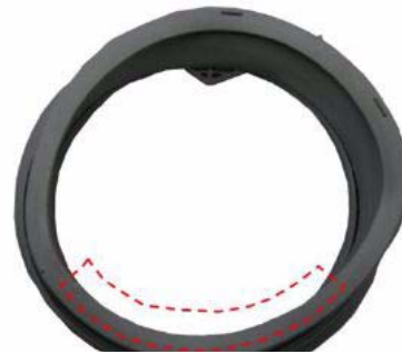
b) Den Bereich der Türdichtung, an dem hauptsächlich Beschädigungen auftreten.