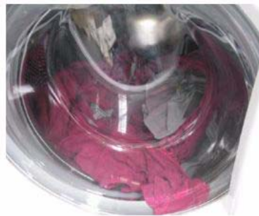
a) Wie Kleidungsstücke eingeklemmt werden.