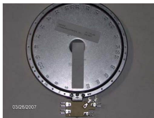
Zona de cocción vista de atrás