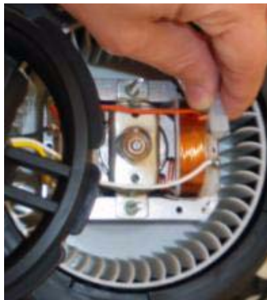
Abb. 7: Kunststoffabdeckung entfernen