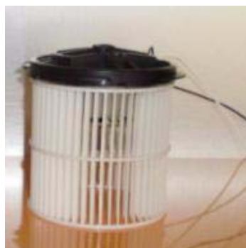
Abb. 5: Haubenmotor