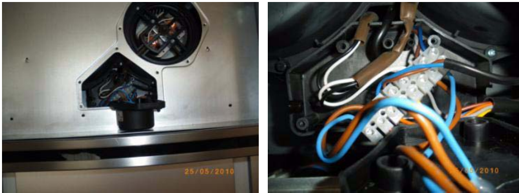
Abb. 3: Motorverdrahtung lösen