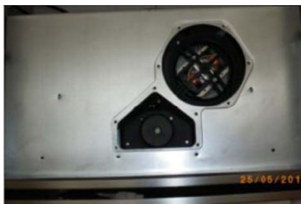
Abb. 2: Haubenmotor

Die Dunstabzugshaube aus dem Küchenmöbel ausbauen. Die Motorabdeckung entfernen.