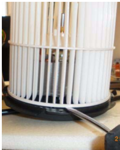
Abb. 8: Vor dem Wiedereinbau sicherstellen, dass es keine Berührung zwischen Lüfterrad und Motorgrundplatte gibt.