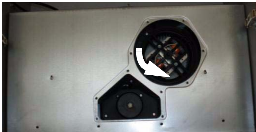
Abb. 4: Motorgrundplatte entfernen